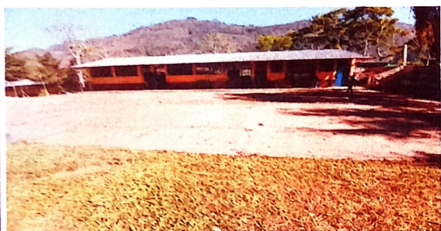
Foto1: Se observa que el ambiente sociocultural esta sin techo.