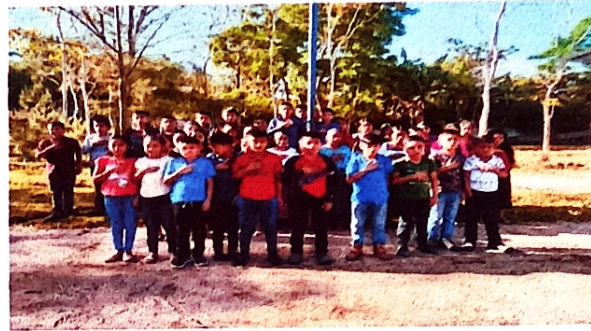
Foto 2: Se observa que el ambiente que los alumnos realizan acto civico bajo el sol.